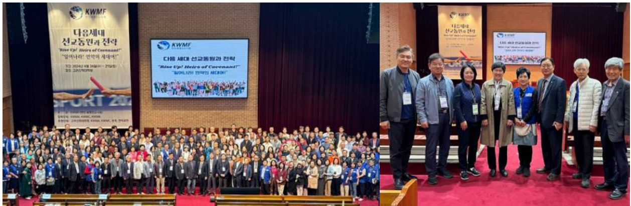
사진: 선교대회에 참석한 선교지도자들과 함께

2024년 4월에는 천안에 위치한 고려신학대학원에서 한인세계선교사회(KWMF) 소속 170여 개국에서 사역하고 있는 약 300여명의 한인 선교지도자들이 모였습니다. 한국교회 세계선교의 세대 계승을 위해 다음세대 선교동원과 전략 모색을 위한 선교대회였습니다. 3박 4일 동안 현세대와 다음세대가 함께 모여 다음세대를 어떻게 세워야 하는지를 함께 고민하는 선교대회였습니다.