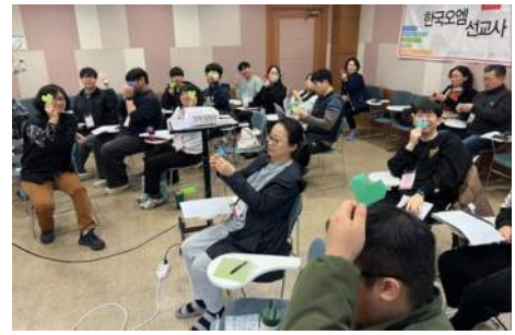
사진: 전도 실제 강의와 훈련