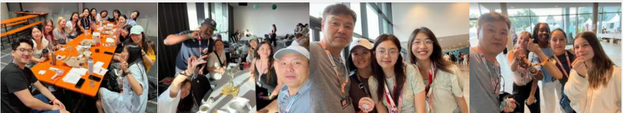
사진: 한국을 사랑하는 사람들의 모임, 프랑스 다문화 자녀, 선교사 자녀, 한국문화를 사랑하는 글로벌 청소년