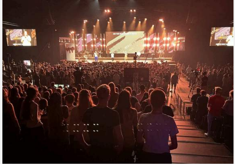
사진: 등록 및 오전과 저녁 집회 모습