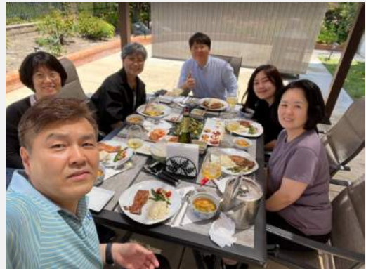
사진: 헤브론 원형학교 & 순회선교단 방문