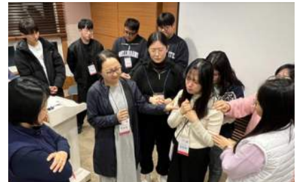
사진: 수료식(위쪽), MK돌봄(왼쪽부터), 한남대 선교관 방문, 기도 시간