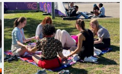
사진: 참가국 지도, 숙소, 찬양과 기도의 시간, 성경공부와 소그룹 시간

독일의 남부 Offernburg 에서 일주일 동안 전세계 60여개국에서 모인 수 천명의 청소년들과 함께 하나님의 능력이라는 주제로 오엠 국제 청소년 컨퍼런스가 열렸습니다. 저희는 한국과 미국에서 지원한 청소년들을 인솔해 팬데믹 이후 처음으로 틴스트릿 유럽에 다시 참석을 하게되었습니다. 하나님께서는 미국 애즈베리 대학에 임하셨던 것처럼 이곳에 모인 전세계 십대들 위에 놀라운 성령의 임재하심으로 역사하셨습니다. 이번 컨퍼런스는 그 어느 때보다 강력한 하나님의 역사가 나타난 놀라운 은혜의 시간들로 가득했습니다.